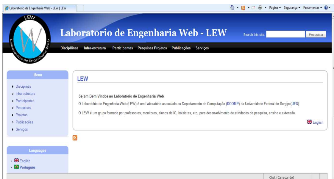
Figura 1: página inicial do portal LEW

Conforme observado na Figura 1, um usuário cadastrado pode acessar os serviços e conteúdos de projetos e disciplinas através do menu . Além disso, nessa figura é possível ver que os usuários online no site podem utilizar o bate-papo, localizado no canto inferior direito, para conversar.